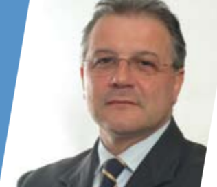
Assessore all'Urbanistica Massimo Bossi